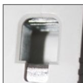
pojemność zacisków 16mm 2