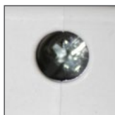
zaciski/sruby ze stali ocynkowanej