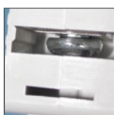
możliwość połączenia za pomocą szyn grzebieniowych