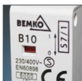
kontrolka sygnalizująca zadziałanie